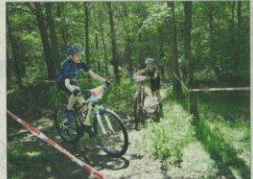
Man kunne vælge mellem den almindelige rute eller chicken run, som var en lettere vej op.

■ Hedder Apfos Liga Løbet. Det er klassen Ege under World Cuppen. Der var både motionister og klubryttere med i går. Varde Cykelklub arrangerede sidste sommer DM i Blåbjerg Plantage med succes. Dansk Cykel Union har herefter spurgt, om klubben ville arrangere dette løb.