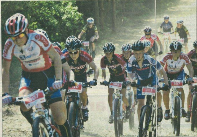
I alt 450 ryttere var tilmeldt, da Varde Cykelklub i går afviklede et internationalt mountainbike-løb. Løbet blev kørt i Søndre Plantage.

Søndre Plantage er syv kilometer lang, og den skal tages nogle gange, alt efter klassen, man kører i. Eliten kører fem runder, og de hurtigste kan klare runden på 19 minutter. Så går det også