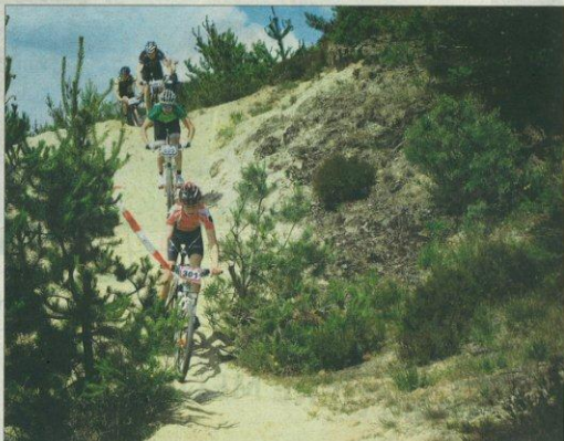
Kristi Himmelfartsdag vil den nordeuropæiske elite i mountainbike være samlet i Søndre Plantage.