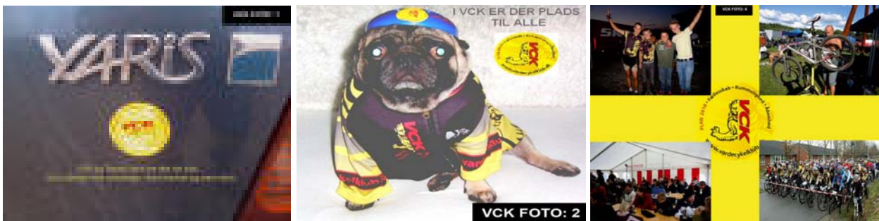
Her er de tre førende billeder fra foto konkurrencen. Gå ind og afgiv din stemme

Præmierne, som er tre komplette sæt VCK klub tøj ( Tricot m/korte ærmer - Selebuks u-panel - Cykelsok 3 par – Sommerhandske ) overrækkes til vinderne på VCK's Generalforsamling d. 17. februar 2009.